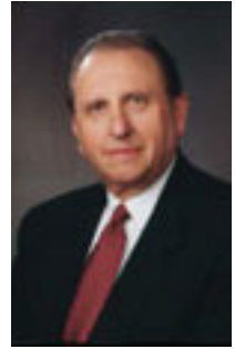
Thomas S Monson