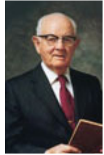
Spencer W Kimball