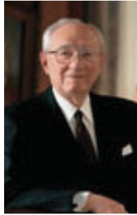
Gordon B Hinckley