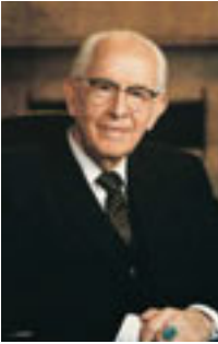
Ezra Taft Benson