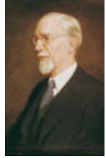
George Albert Smith